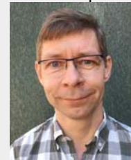
Techn. Kundenservice dental 2000