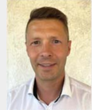
Medizinprodukteberater dental 2000